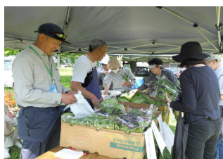
「せせらぎ市」の様子