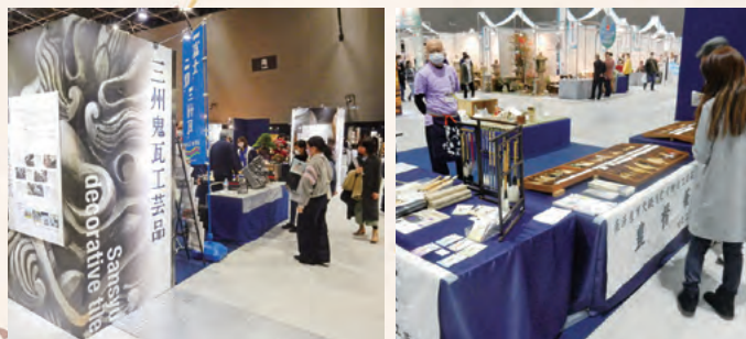
※写真は令和3年度愛知大会の様子