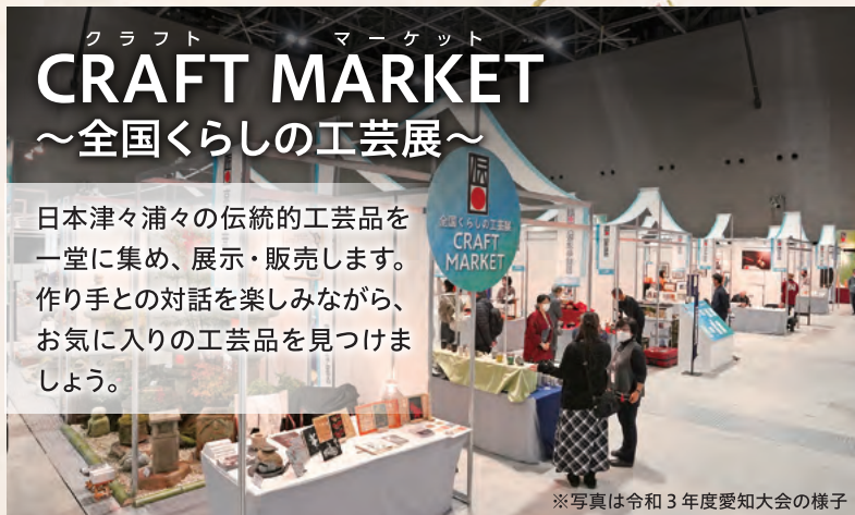
※写真は令和3年度愛知大会の様子

日本津々浦々の伝統的工芸品を一堂に集め、展示・販売します。作り手との対話を楽しみながら、お気に入りの工芸品を見つけましょう。