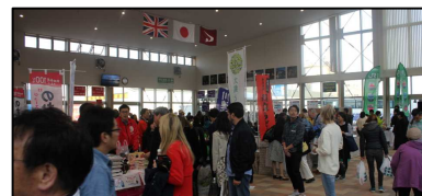
(令和元年度、クイーン・エリザベス寄港)