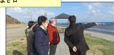
船社による県内視察(令和3年度)