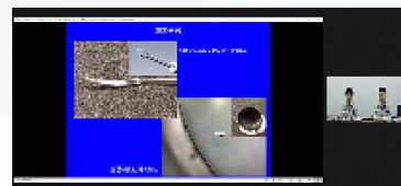
オンライン商談のイメージ