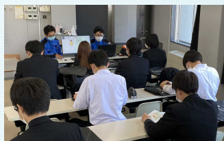
【高専での企業説明会】