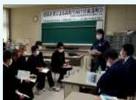
【高校での企業説明会】