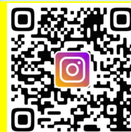
【あきた建設女性ネットワーク (クローバー)インスタグラム】