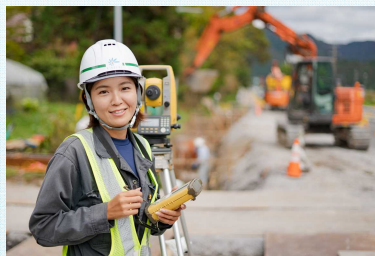
【目標となる先輩社員を紹介】