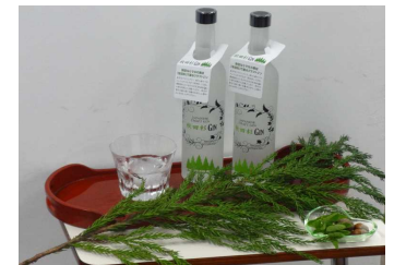
商品開発した秋田杉GIN