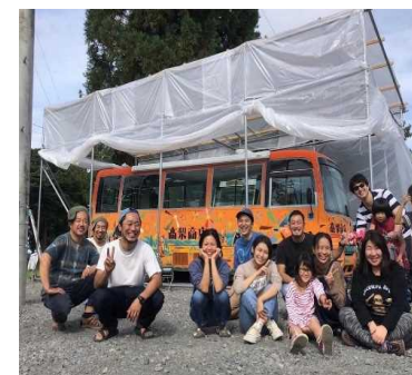
高梨商店と地域のみなさん