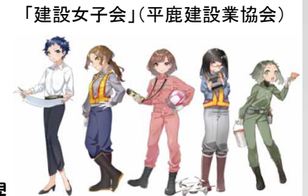
公式応援キャラクター

→ 県の「あきた建設女性ネットワーク」とも連携し、女性活躍に関する情報発信やキャリアアップ等に取り組んでいく。あきた建設女性ネットワーク「クローバー」