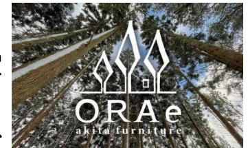
ORAe(オラエ)ブランドロゴ