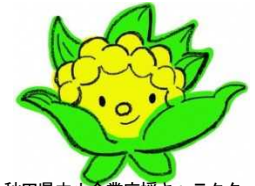
秋田県中小企業応援キャラクター 「がんばっけさん」

【意欲ある中小企業の取組支援】 （支援事業名：かがやく未来型中小企業 応援事業(製造業向け)、攻めのサービス産業等応援事業(非製造業向け)）