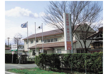
秋田県醗酵工業(株)本社