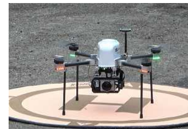
林業測量用ドローン