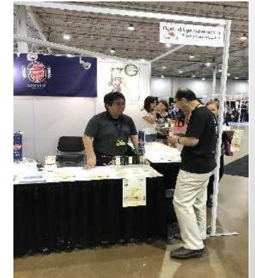
海外向け商談会の様子

→ グルテンフリー食品の市場は今後も拡大するため、引き続き販路拡大を図っていく。