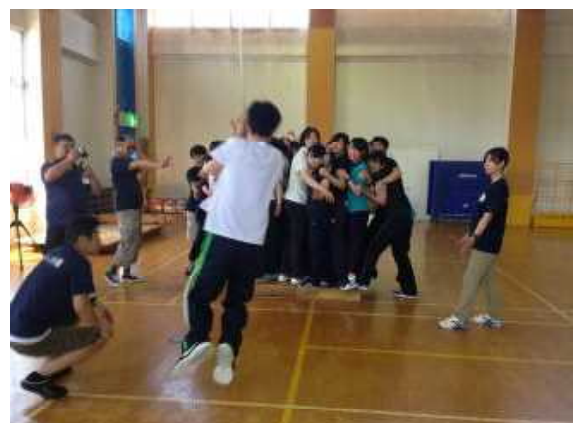
▲「川渡り」 行くよーっ！落ちないで！