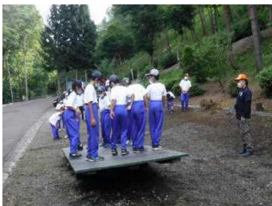
▲「シーソー」 揺れるよ！ゆっくり