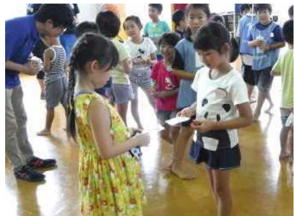
▲「ウブンツ」 セーの！同じ絵はどこかな？