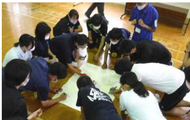
▲「ビーイング」 気付いたことをみんなで書こう