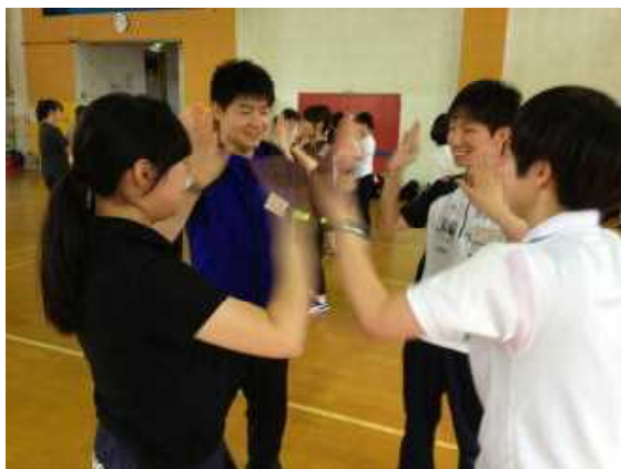
▲「ビート」 4人組でもできるかな？