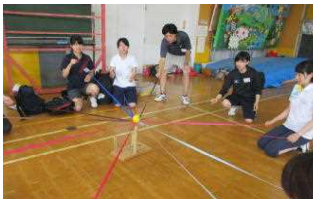
▲「リングTOリング」 そーっと下ろすよ

※令和7年度から、プロジェクトアドベンチャー (PA) の名称がAAPに変更となりました。