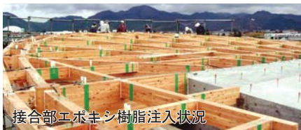
接合部エポキシ樹脂注入状況

この度、秋田県優良工事表彰の栄誉を賜り、関係各位には衷心より感謝と御礼を申し上げます。 21世紀を担う中高一貫教育校の施設に携われ、貢献することができましたことは大変な喜びであり、社員一同、受賞を誇りとし、これに奢ることなく安全管理の徹底、品質の向上・技術の研鑽に努め、地域社会とともに発展していく企業として、努力精進していく所存でございます。 今後とも、ご指導ご鞭撻を宜しくお願い申し上げます。