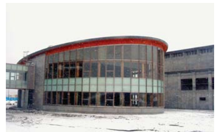
メディア棟（南東側）全景