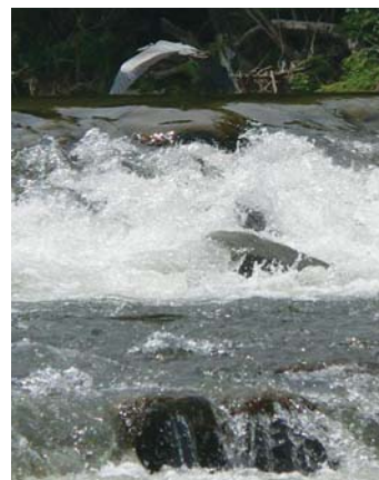
完成現場で餌の魚を探す鷺