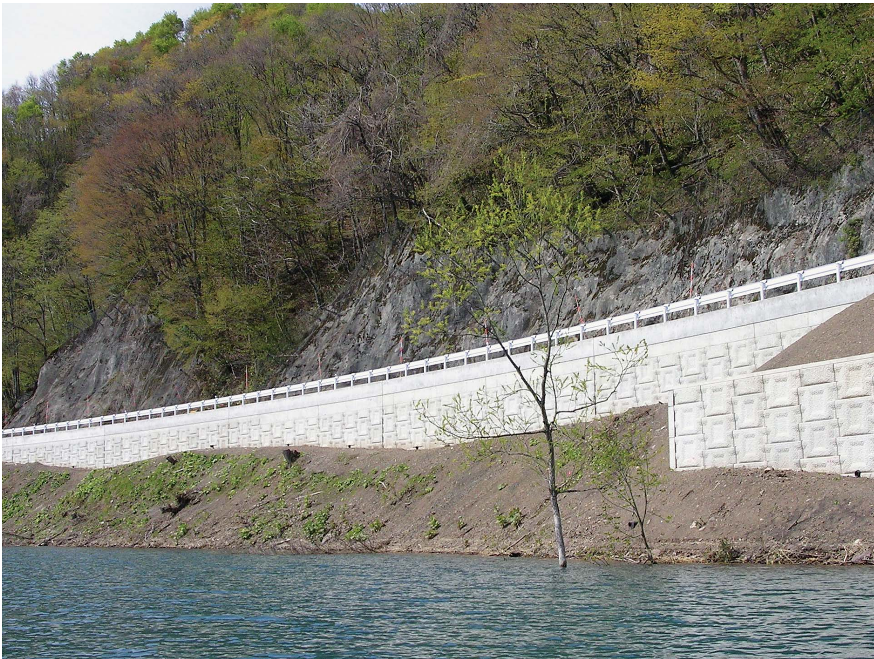
第26回秋田県優良工事表彰から 国道道路改築事業 HA22-K2 鑑畑工区 (仙北郡田沢湖町)