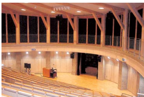
メディア棟メディアホール（ステージ側）

この度は、当地域を代表する工事に参画させていただき、かつ、優良工事表彰の栄誉に浴し、関係各位の皆様には大変感謝致します。 今後も御指導、御鞭撻の程、宜しくお願い申し上げます。