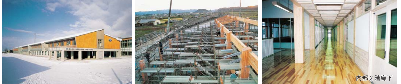
大断面集成材組み立て状況

県北地域に於ける初の中高一貫校に携われた事で大変栄誉に思っていたところ、優良工事の受賞に浴する事ができ誠に感慨深いものがあります。 丸山建設(株)様との企業体であり、工事施工や運営面で大変御難儀をかけると共に発注機関の関係各位様の熱情溢れるご指導の賜物と厚く御礼を申し上げます。これからも高品質で耐久性に優れた建築物の構築に努力し社会貢献に努めて参ります。