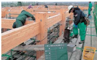
エポキシ樹脂注入状況