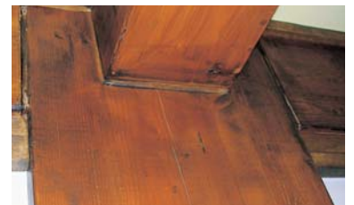
大断面柱と梁の接合状況