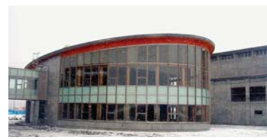
メディア棟と中学体育館棟

第26回秋田県優良工事表彰の栄誉を賜り誠にありがとうございます。また、関係各位のご指導に心から厚く御礼申し上げます。 特定建設共同企業体各社の代表者をはじめ、現場代理人及び工事関係者の喜びは一入であります。 これを機に、一層精進を重ね「安全第一・品質向上」を目指し、地域社会の繁栄と発展に貢献したいと思います。