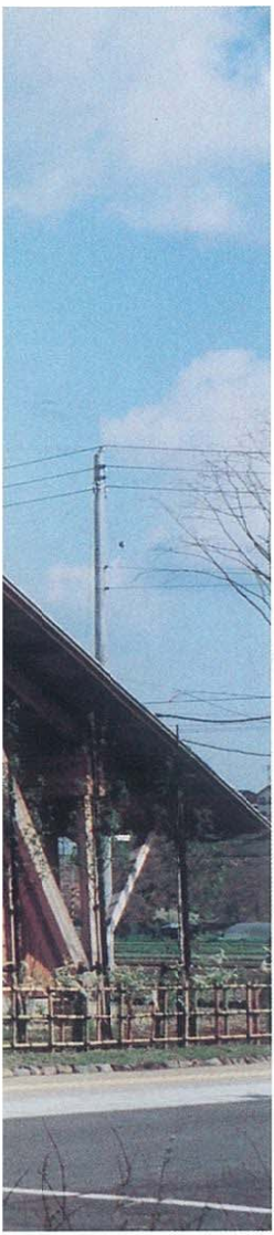
秋田市上北手荒巻