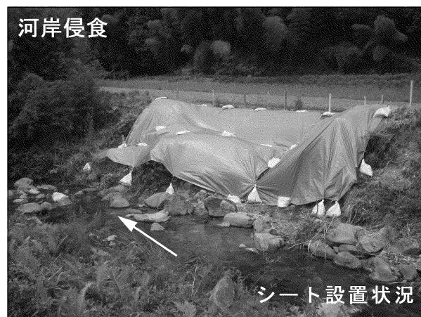
ころもがわ 衣川 (由利本荘市)