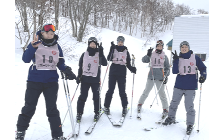
2月 ウィンタースポーツ研修