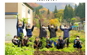
にんじん収穫ボランティア

「アクティブ・ボランティア」と称し、横手市山内三又地区の田植えと伝統野菜山内にんじんの収穫作業に取り組んでいます。また、地域のイベントや祭事行事などにもボランティアとして大勢の生徒が参加しています。他にも特別支援学校などでのボランティア活動や清掃活動などを通して、地域とのつながりを強めています。