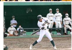
部活動の大会から