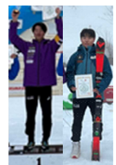
全国高等学校選抜スキー大会