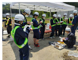
工業科目「土木施工」