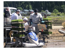
教科「地域」の校外授業