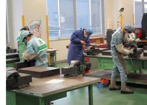
ものづくりコンテスト

部活動 運動部（11） 野球、陸上競技、バスケットボール、バレーボール、卓球、ソフトテニス、ソフトボール（女）、剣道、柔道、水泳、スキー