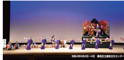
全国高等学校総合文化祭