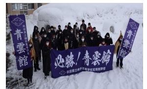
(かまくら作り体験学習)