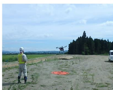
UAVによる起工測量状況

※ICT（Information and Communication Technology）：情報通信技術（情報処理や通信に関する技術、産業、設備、サービスなどの総称）