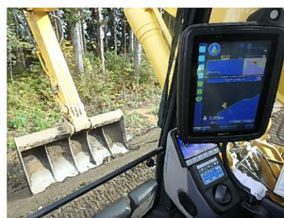
ICT建設機械による施工状況