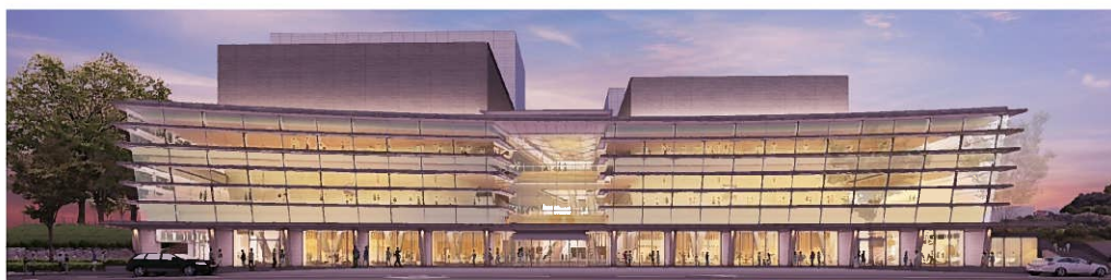
あきた芸術劇場 完成予想図