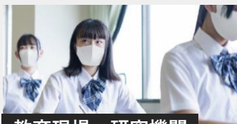
教育現場・研究機関

お客様訪問がある接客クルーやどうしても出社せざるを得ない職場でも、安心して働けることを目指します。