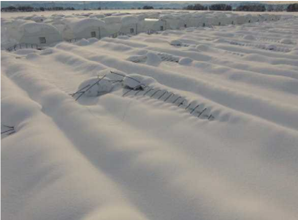
ほうれんそう：ハウス倒壊（横手市十五野）