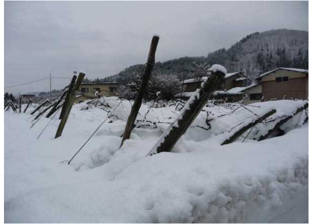
ぶどう：棚の倒壊（横手市大沢）