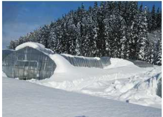
せり：ハウス倒壊（湯沢市関口）