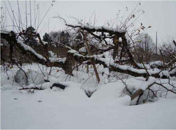
りんご：主枝の枝折れ（横手市増田）