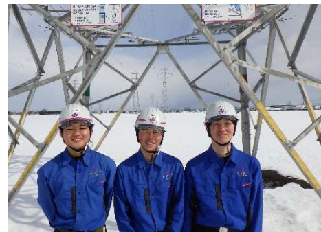
送電線工事作業現場