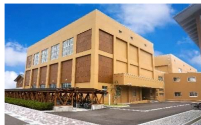
能代松陽高等学校体育館

一種電気工事・一級電気施工管理技士など自分自身のスキルをアップさせるためにも資格・免許取得について各種助成を行っております。