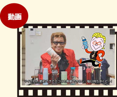
YouTube動画 「マイボトルのススメ！ ～フラなし生活編～」

実施するスーパー：「アマノ」、「いとく」、「グランマート」、「ナイス」、「マルダイ」（順不同） ※一部店舗を除く