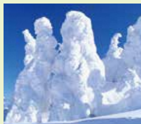
北秋田市 / 森吉山の樹氷