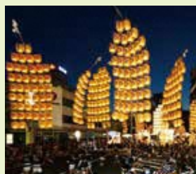
秋田市 / 秋田竿燈まつり