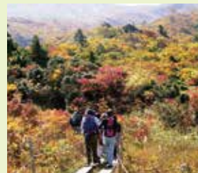
湯沢市、東成瀬村 / 栗駒山

雪国ならではのウィンタースポーツや、山歩き、釣りなど、季節の移り変わりとともに1年中自然を楽しむことができます。他にも、県内各地に数多くあるさまざまな泉質の温泉も魅力です。