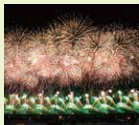
大仙市 / 大曲の花火