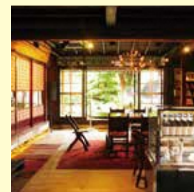
湯沢市 / ヤマモガーデンカフェ