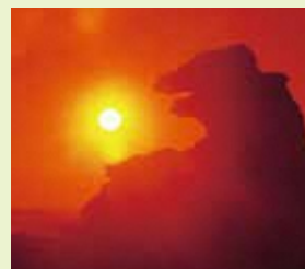
男鹿市 / 瀬崎のゴジラ岩

日本海に面し、世界自然遺産の白神山地や鳥海山、男鹿半島などの大自然に囲まれています。四季がはっきりしていて、季節の移ろいを目で楽しめるのも秋田の魅力。