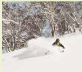
仙北市 / たざわ湖スキー場