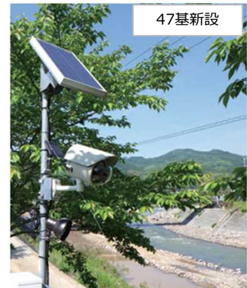
図 河川監視カメラの例