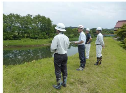
図 県と市町村の合同巡視の例