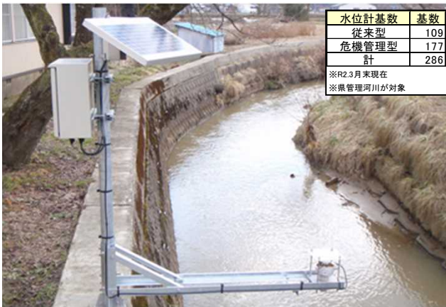
図 危機管理型水位計の例