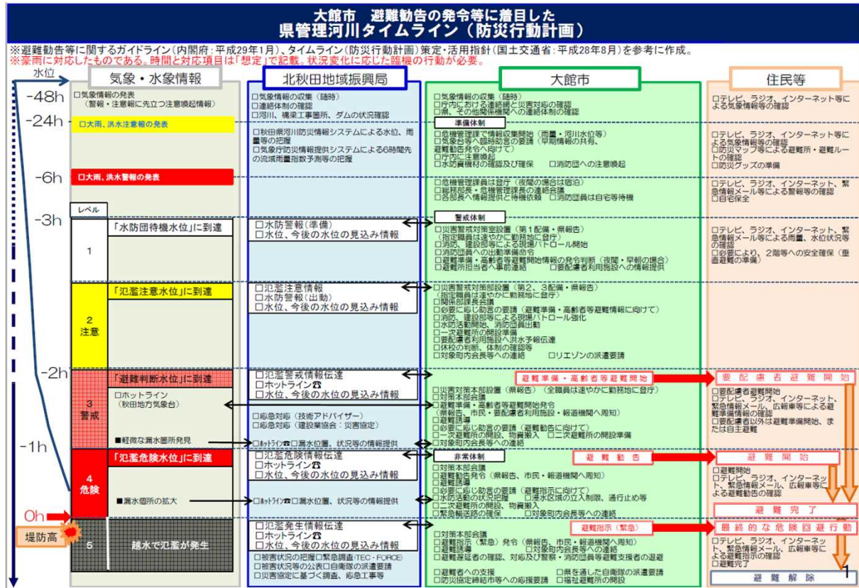
図 タイムラインの例