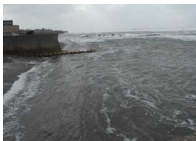
港内の波浪の状況