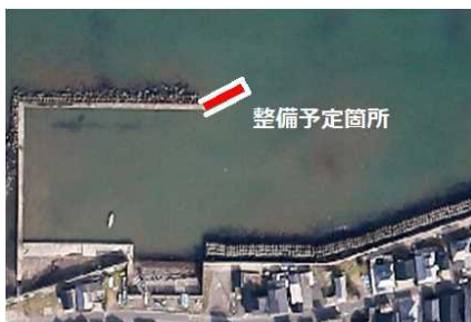
防波堤整備予定箇所