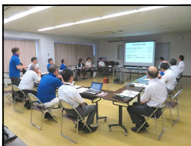
調査研究委員会の様子