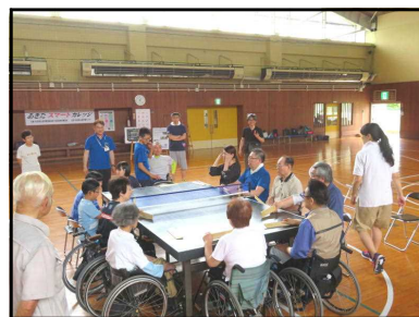
卓球バレーを体験中

3回目は「語ろう!」をキーワードに、障害者スポーツについて知ったことや体験したことをもとにワールド・カフェを行いました。小学生から80代まで幅広い年代の方々が集い、それぞれの思いを話し合いました。一緒に時間を過ごすことで、心の壁をなくせることを実感しました。