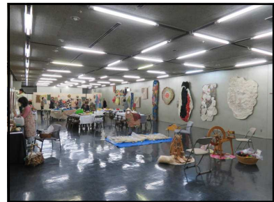
染・紡・編・織・縮の手しごと展

令和2年度の展示開催を希望される個人・団体の方は、令和元年12月27日(金)までに、生涯学習センターあてに「展示ホール利用申込書」をお届けください。希望をもとに実施時期を調整し、年間計画を決定します(先着順ではありません)。申込書の様式や留意事項については、生涯学習センターの受付で配布しているほか、センターのホームページにも掲載しています。