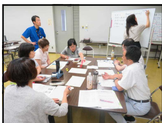
講座の企画を検討中