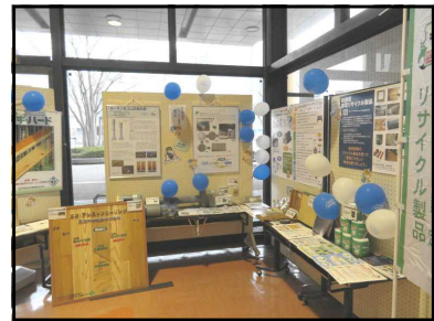
「限りある資源を大切に」展