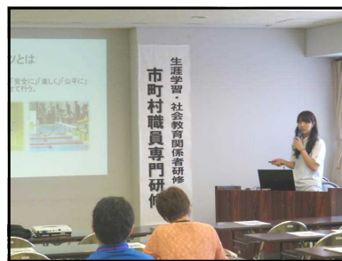
障害者スポーツの意義を学ぶ

「来年度の事業に、障害者も参加できる教室を考えたい」という市町村もあり、今後の広がりを期待したいと思います。