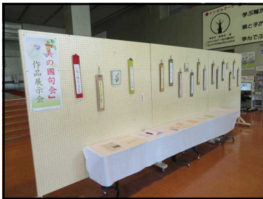
「美の国句会」作品展示会