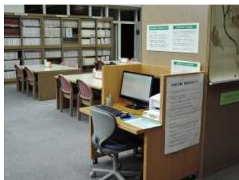
閲覧テーブルと検索パソコン