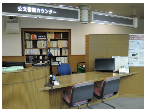
閲覧室カウンター