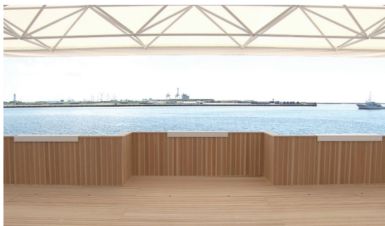
御放流所からの眺め