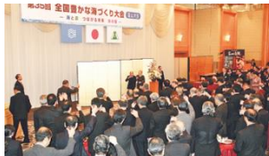
富山大会の歓迎レセプション会場

県内外からの招待者に秋田県が誇る農林水産物を豊富に 使用したメニューを堪能してもらい、豊かな秋田の食でおもてな しします。