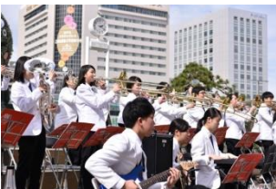
歓迎演奏イメージ

本県水産業の特色や地元のおいしい魚介類、食文化、 そして環境保全活動など、本件の魅力を県内外に発信 することを目的として関連行事を開催します。