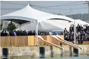
御放流台イメージ