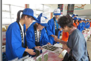
【学校と社会との接続】