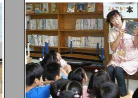
【生涯学習・文化財保護】