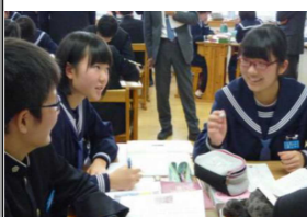
【資質・能力の育成】