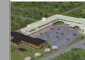
【学校教育を支える環境の整備】