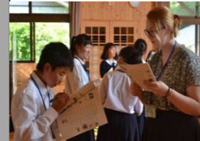
【国際教育・国際交流】