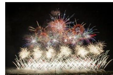
全国花火競技大会「大曲の花火」