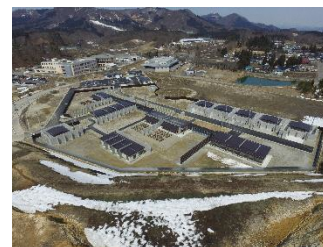
新たに整備した製造拠点