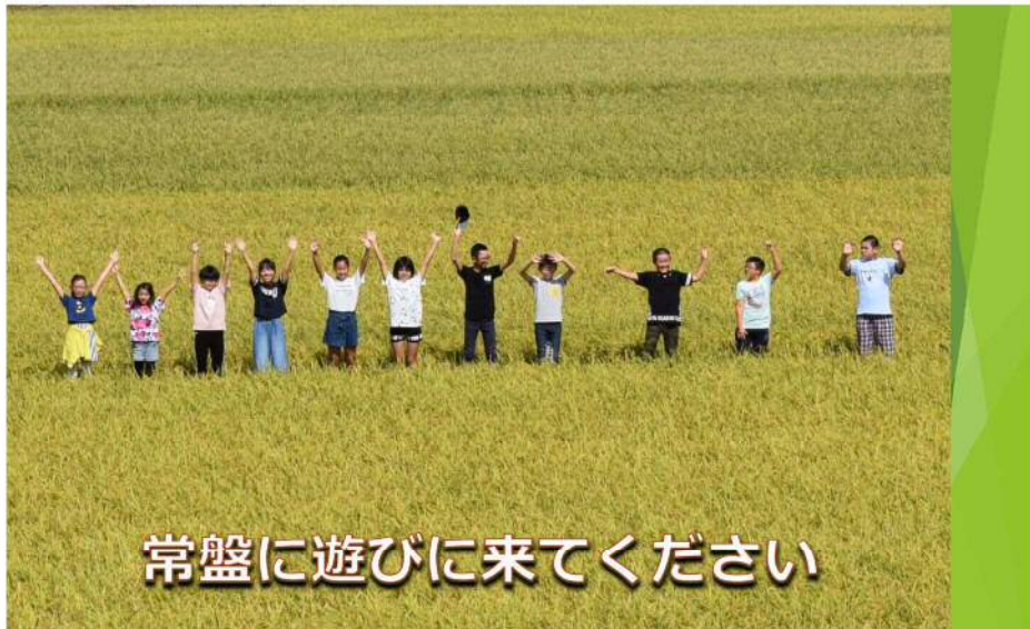
常盤に遊びに来てください