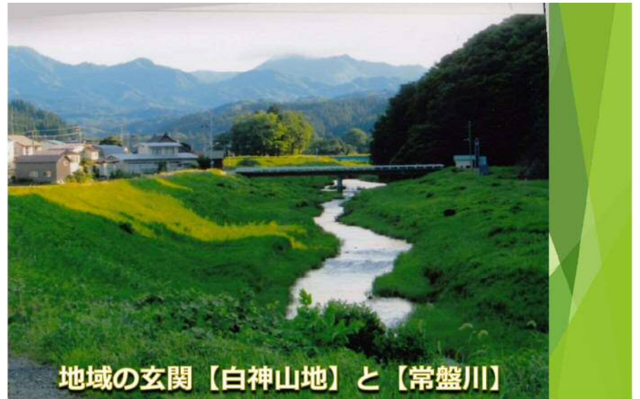
地域の玄関【白神山地】と【常盤川】