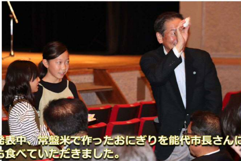
発表中、常盤米で作ったおにぎりを能代市長さんにも食べていただきました。