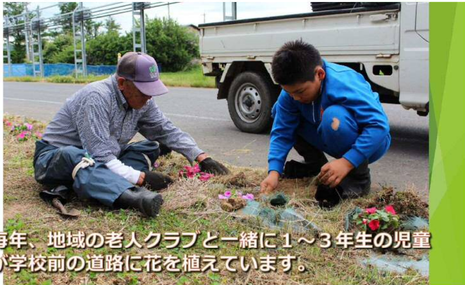
毎年、地域の老人クラブと一緒に1～3年生の児童が学校前の道路に花を植えています。