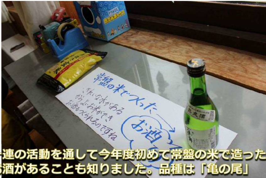
一連の活動を通して今年度初めて常盤の米で造ったお酒があることも知りました。品種は「亀の尾」