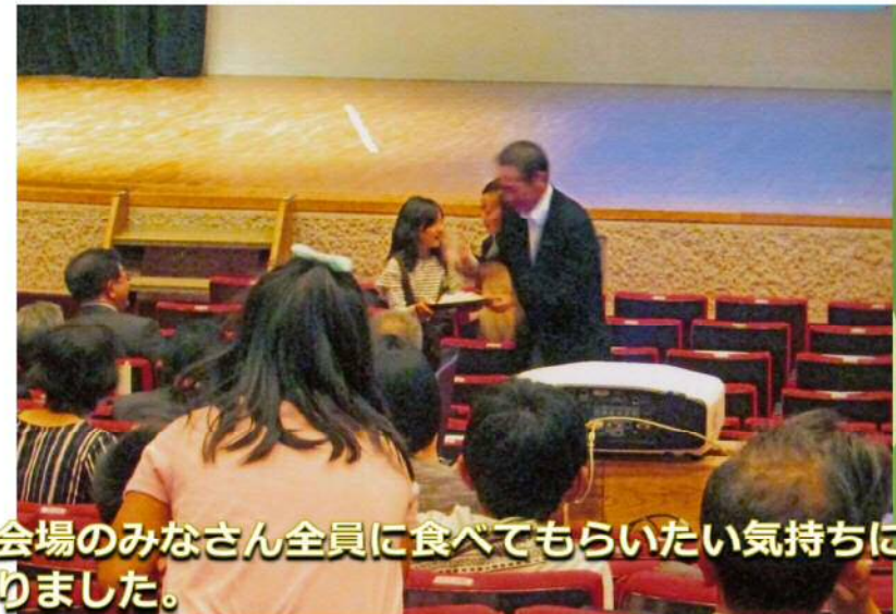
会場のみなさん全員に食べてもらいたい気持ちになりました。