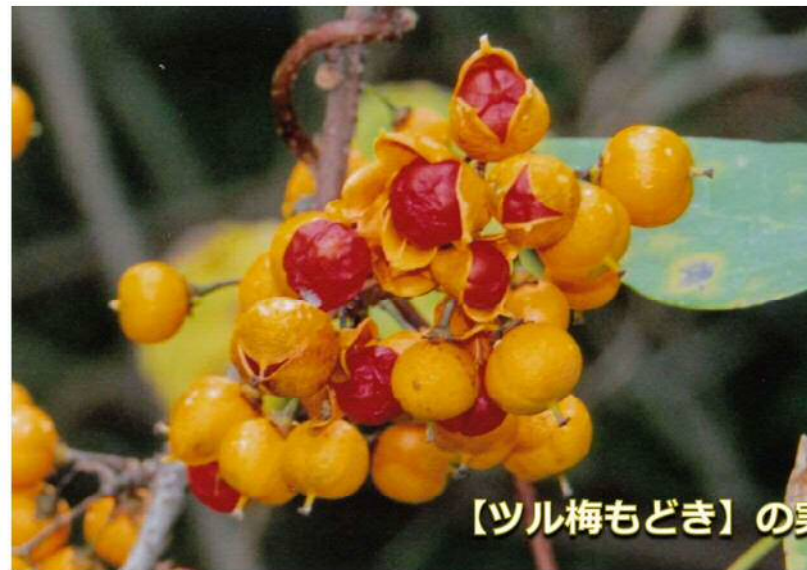
【ツル梅もどき】の実