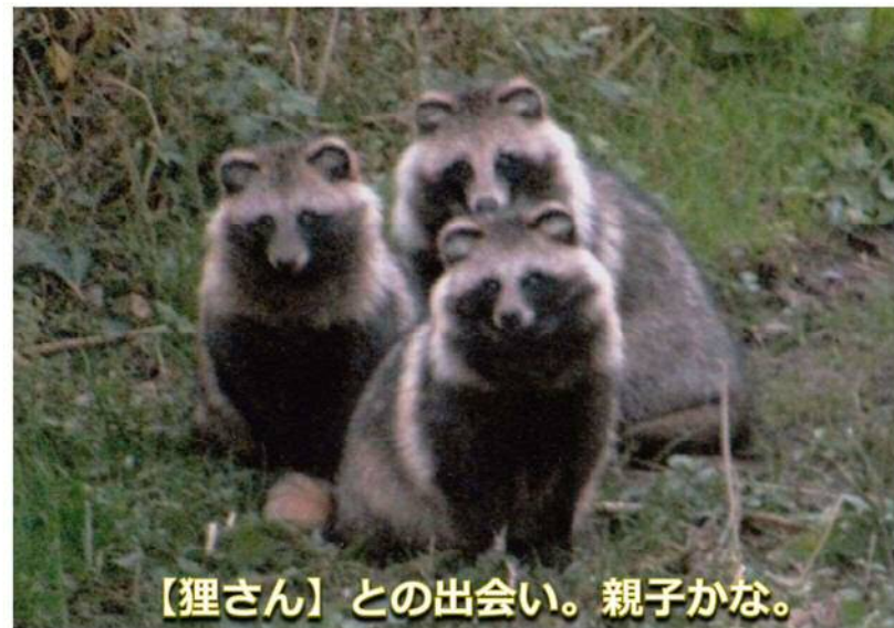
【狸さん】との出会い。親子かな。