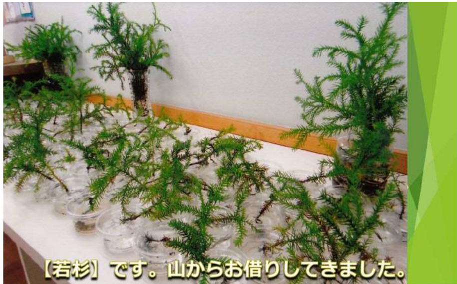
【若杉】です。山からお借りしてきました。