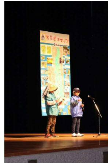
能代市主催の「小学生ふるさと学習交流会」で能代市文化会館大ホール約300名の前で常盤のよさを発表しました。