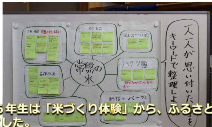
5,6年生は「米づくり体験」から、ふるさと常盤を考えました。いつも教えてもらうだけではなく、自分たちにはできないことはないのか、何ができるのか。一人一人が真剣に考えました。