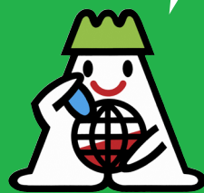
ストップ・ザ温暖化あきた マスコットキャラクター あすぴー

環境にやさしい取り組みに参加して、オトクな賞品をゲットしよう! (エコアクション)