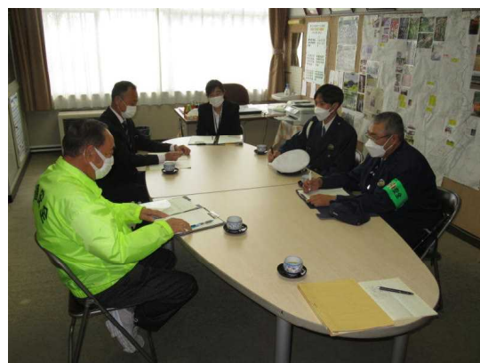
警察官を交えた意見交換