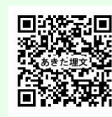
埋蔵文化財センターFacebook