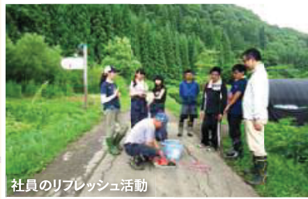
社員のリフレッシュ活動