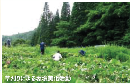
草刈りによる環境美化活動