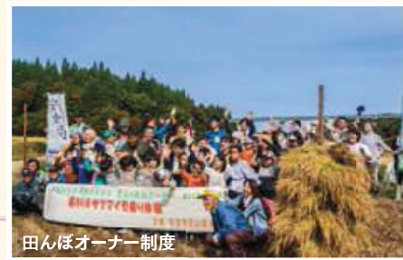
田んぼオーナー制度