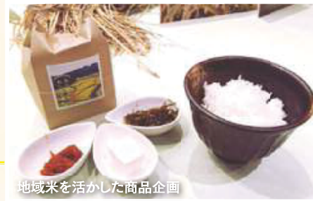
地域米を活かした商品企画