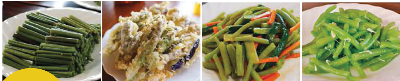
※調理写真はイメージです

お届けする内容等の詳細は、直接お問い合わせください。季節によっては、山菜等を使用した加工商品のお届けとなります。