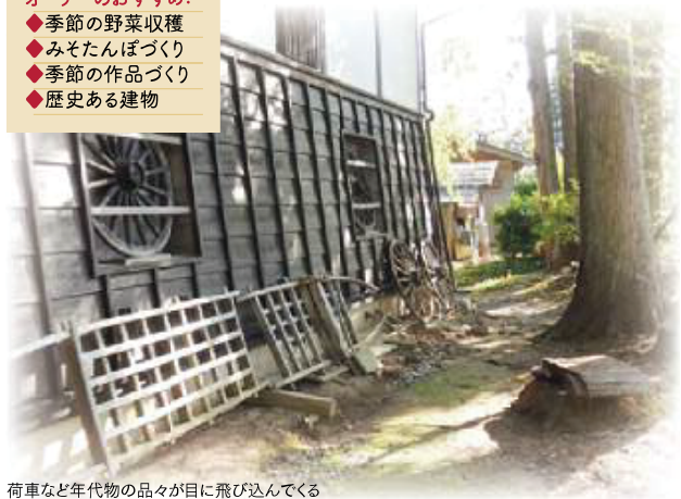
荷車など年代物の品々が目に飛び込んでくる