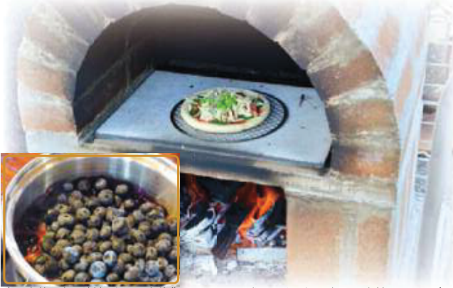
奥羽山麓の太田地域で採れた自然豊かなブルーベリーを使用したジャム。