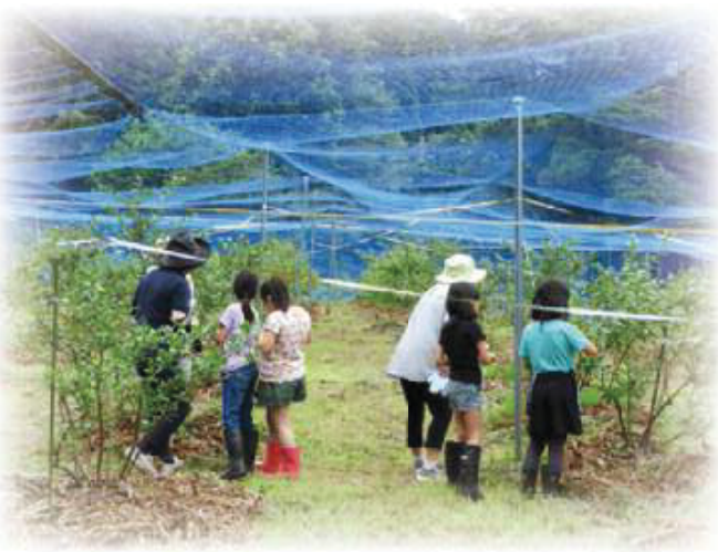
大仙市内の小学生を対象に、ブルーベリーの収穫体験を行いました。

教育旅行などを通じて農業体験を受け入れしている農家が会員協議会です。それぞれの会員がお客様と交流する際に「おもてなし」の気持ちと共に、様々な場面を想定して安全な対応ができるように研修会、安全講習会等を行ったり、お互いに情報交換となる場を設けています。