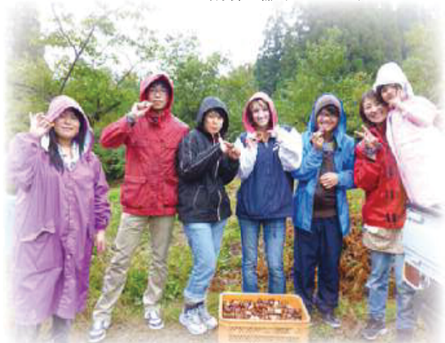
名前の通りの栗農家でもあり、秋には大きな西明寺栗の収穫やゆべし作りも体験できます。