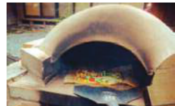
自家製ピザ窯で焼きたてピザを楽しんで!

かたくりの群生地として有名な西木町西明寺地区で、日本一大きなクリ「西明寺栗」の栽培農家が営む民宿。栗園には、かたくりに前後して福寿草や山わさびの花、夏になると山ゆりが咲き誇ります。自然の宝庫である裏山では一緒に山菜採りと旬の味覚をお楽しみください。自宅前には、ローカル線も走るのどかなところ。自然の中でゆったりとした時間をお過ごしください。