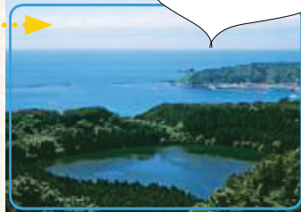
パノラマの絶景を堪能あれ！