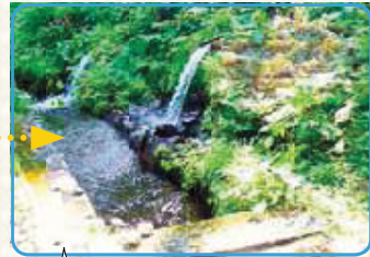
水源地まで遊歩道が整備されており、散策も楽しめます