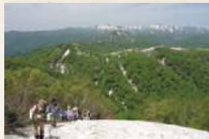
世界遺産白神山地ニッ森登山