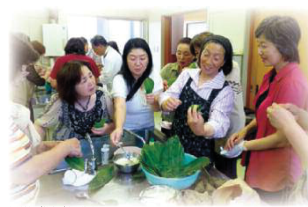
伝統料理(笹巻き)作り体験

日本一の生産量を誇るじゅんさい、サンドクラフト、日本海の夕日。食も人も自然も豊かなこの町で、ゆっくり田舎体験してみませんか?三種町ならではのじゅんさい摘み採り体験は、小舟に揺られながら水面下に自生するじゅんさいを一つずつ丹念に摘み採る作業です。それは大人も子どもも時間を忘れて夢中になれる他にはない体験で、年々体験希望者が増えています。それ以外にも果樹のもぎ取り、郷土料理作りやクラフト体験など、協議会メンバーによる多様なメニューを揃えています。親子体験や子ども会、グループ活動など、お気軽にお問合せください(団体は要相談)。