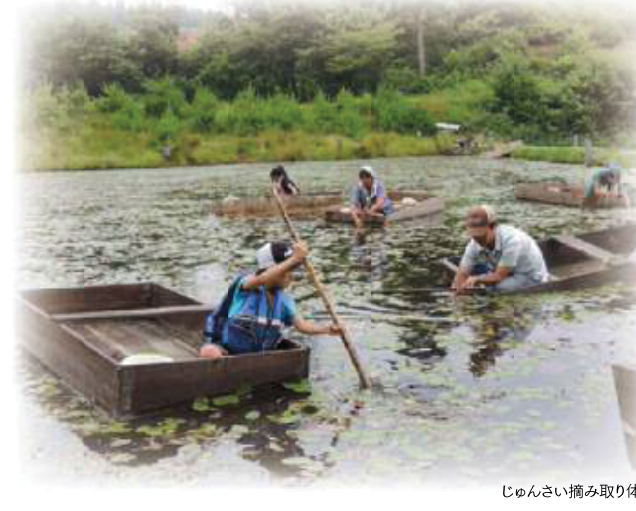
じゅんさい摘み取り体験