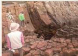
溶岩が冷え固まって出来た「柱状節理」!

大地(ジオ)の活動や生態系、そこに関わる人々の暮らしや歴史を学ぶことができます。