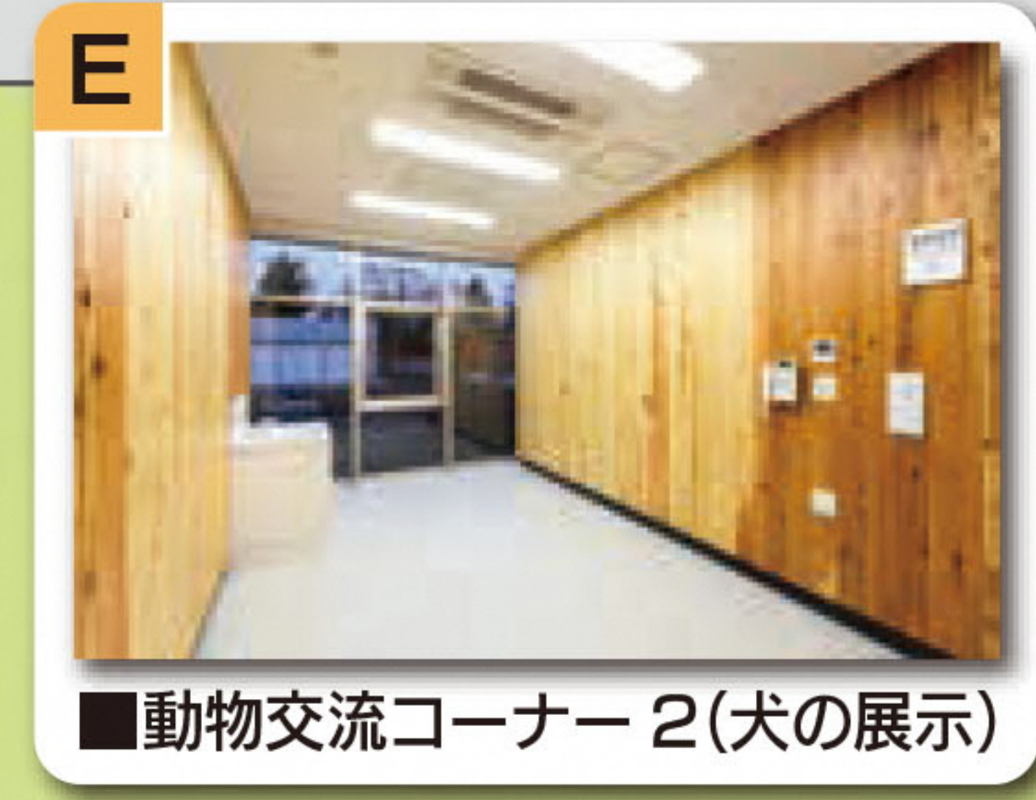
■動物交流コーナー 2(犬の展示)