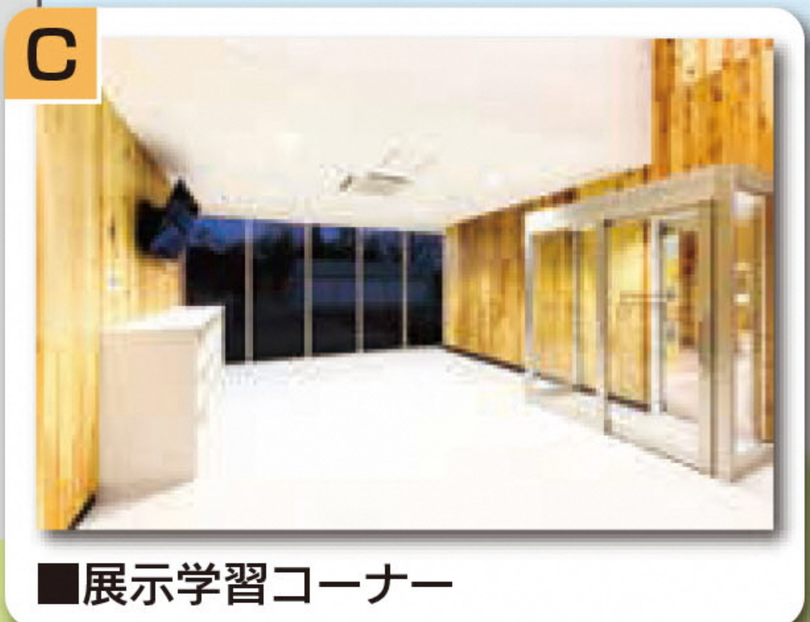
■展示学習コーナー