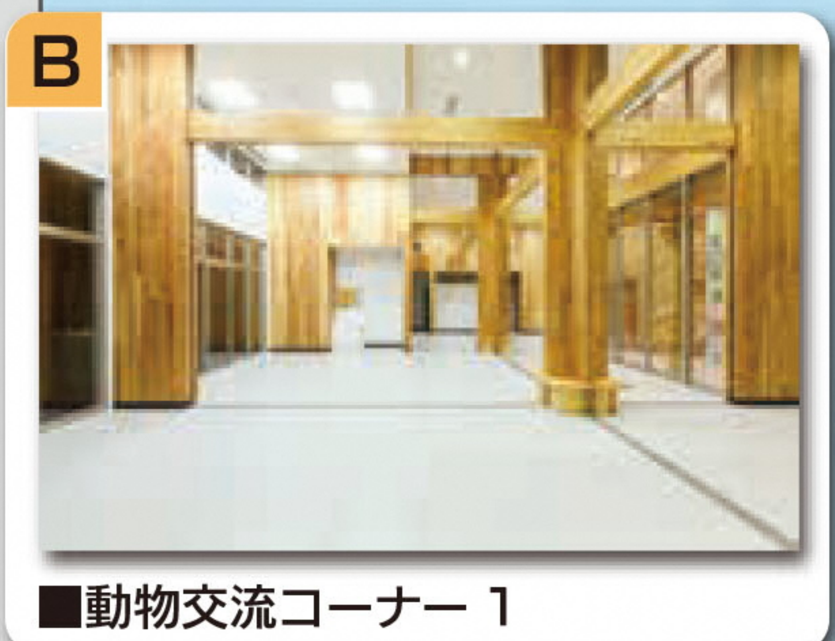
■動物交流コーナー 1