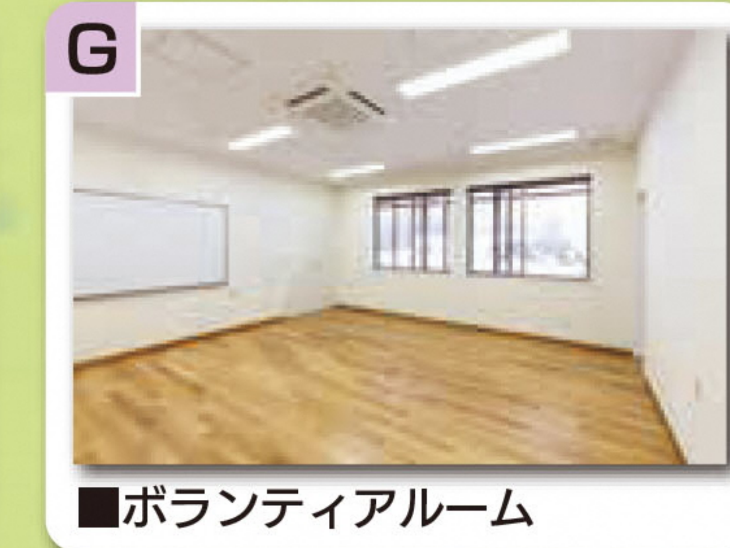
■ボランティアルーム