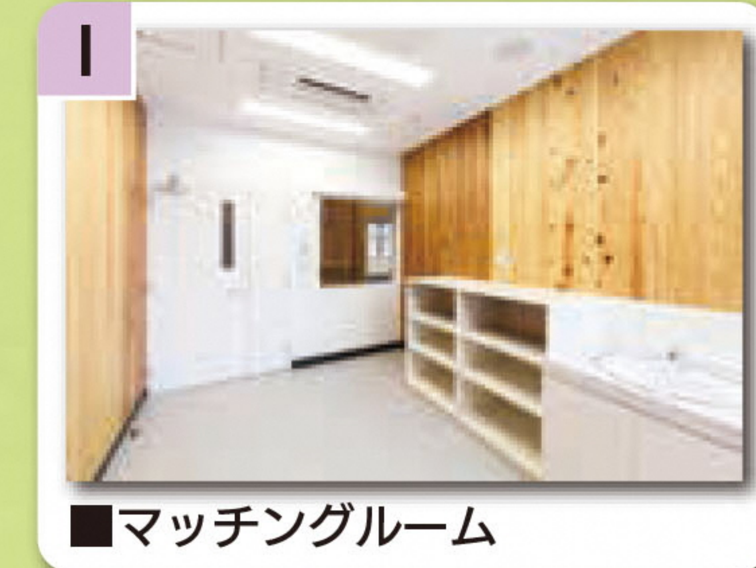
■マッチングルーム