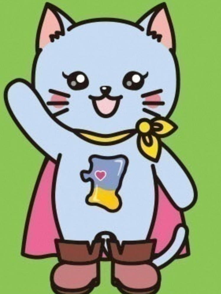
マスコットキャラクター あきにゃん

「ワンニャピアあきた」は、新たな飼い主を待っている犬猫との出会いの場や、同居動物との生活上のアドバイスや健康相談、災害時の動物救護の体制づくり、秋田犬など秋田にちなんだ動物をテーマにした秋田の魅力の情報発信などに取り組む施設です。皆様のご利用をお待ちしています。