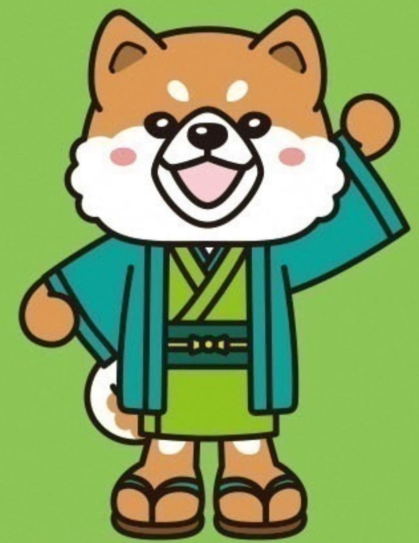
マスコットキャラクター はちすけ