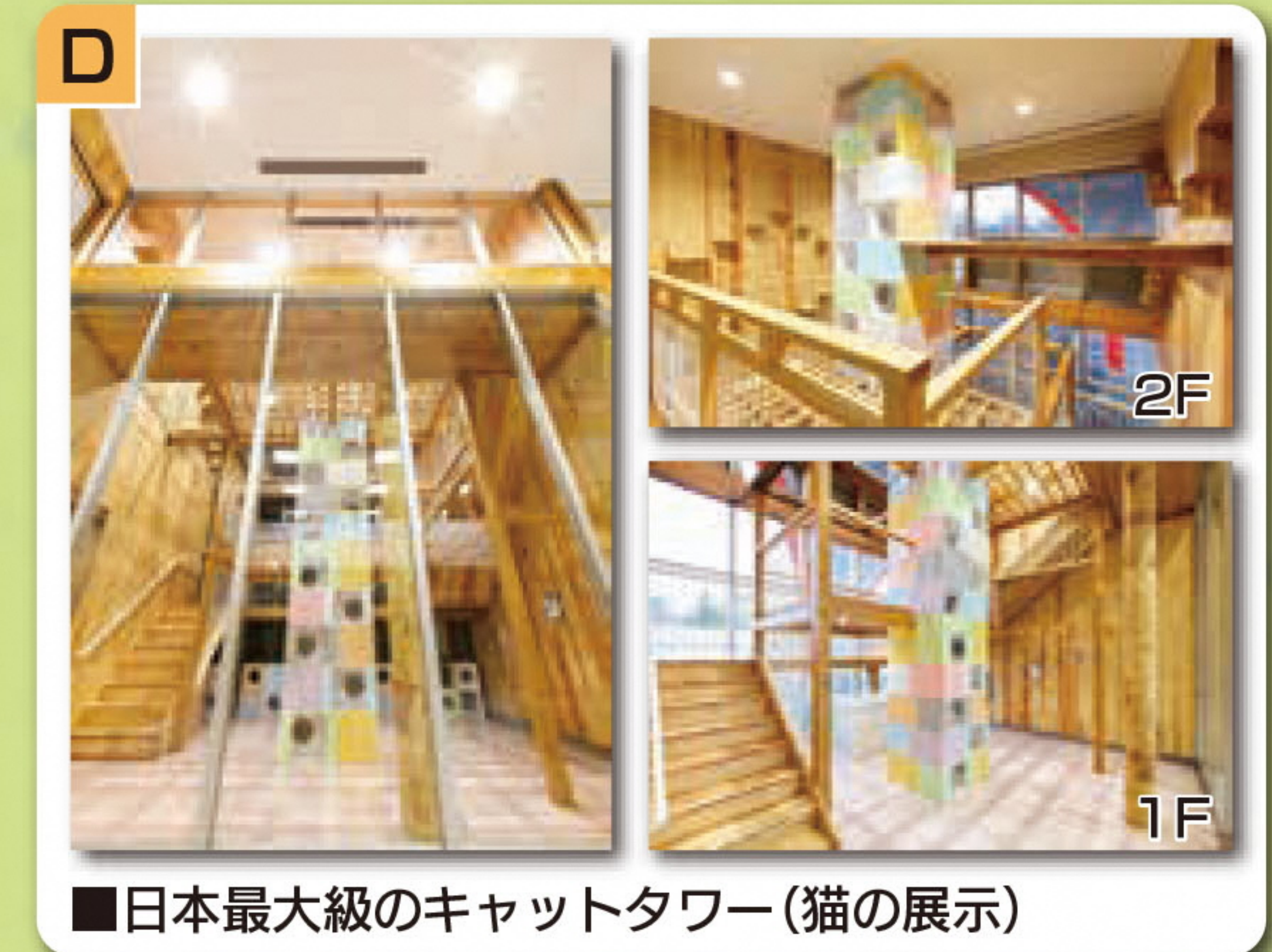
■日本最大級のキャットタワー(猫の展示)