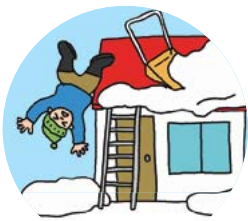
屋根やはしごからの 転落