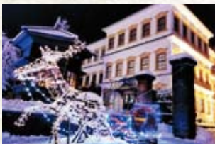
クリスマスマーケットin小坂