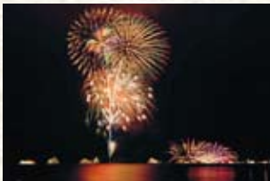
十和田湖湖水まつり