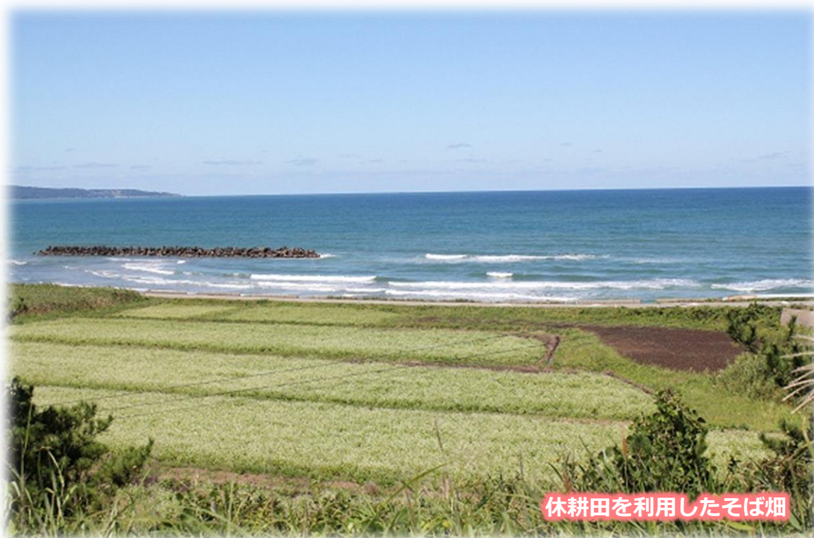
休耕田を利用したそば畑