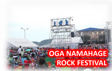
OGA NAMAHAJE ROCK FESTIVAL