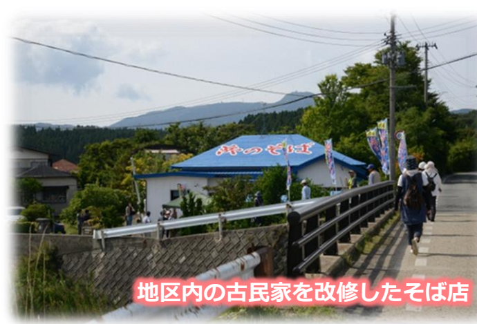
地区内の古民家を改修したそば店