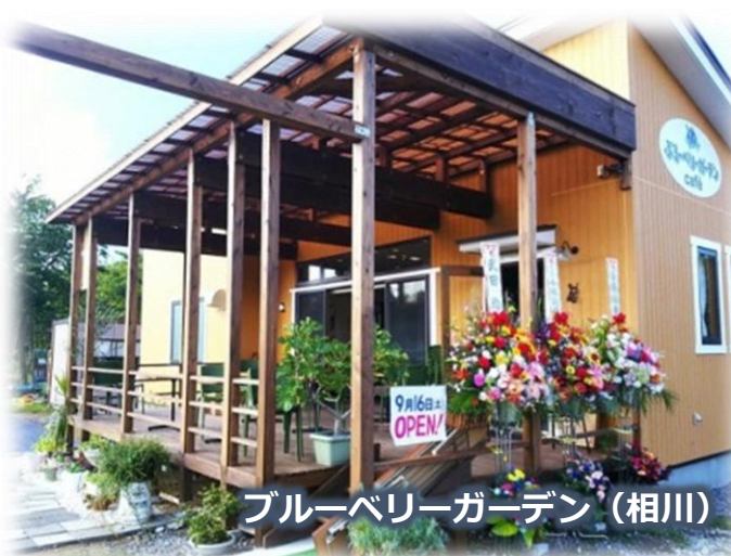
ブルーベリーガーデン (相川)