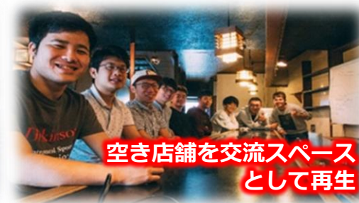
空き店舗を交流スペース として再生

各地区の集落活動に加え、男鹿駅周辺 エリアでは、課題解決に向けた新たな 地域コミュニティが形成されつつある