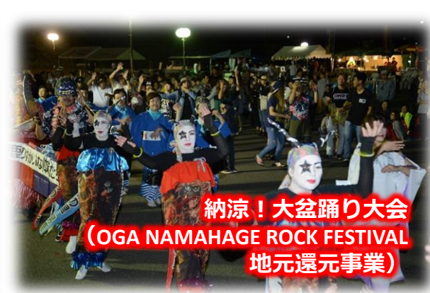
納涼！大盆踊り大会 (OGA NAMAHAJE ROCK FESTIVAL 地元還元事業)