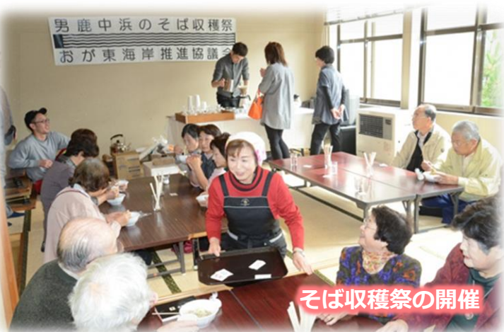
そば収穫祭の開催