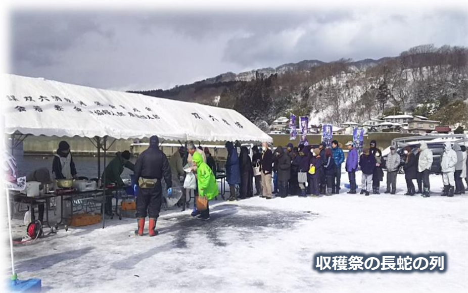
収穫祭の長蛇の列