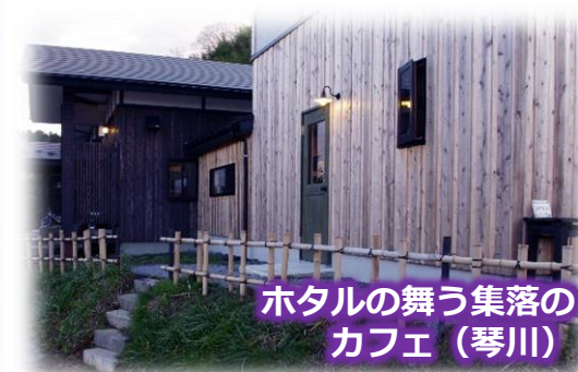
ホテルの舞う集落の カフェ (琴川)