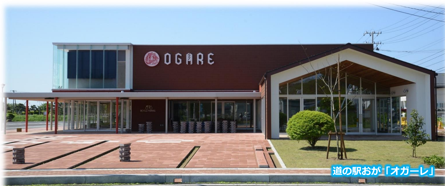
道の駅おが「オガレ」