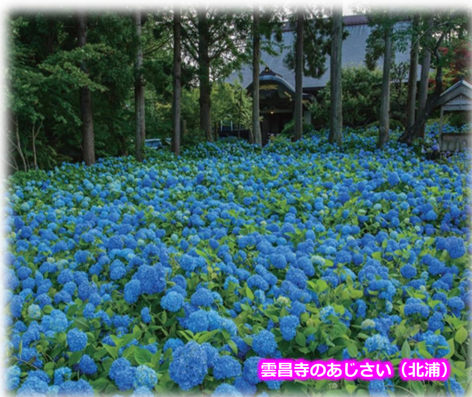
雲昌寺のあじさい (北浦)