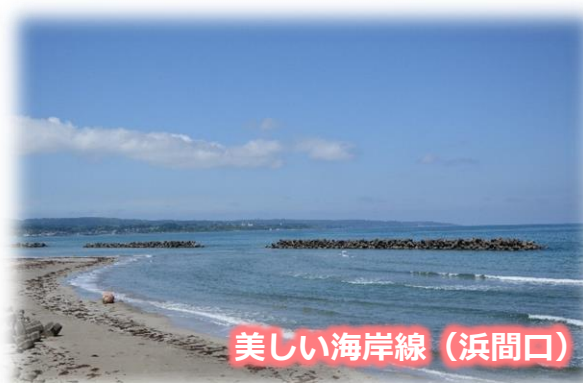
美しい海岸線 (浜間口)