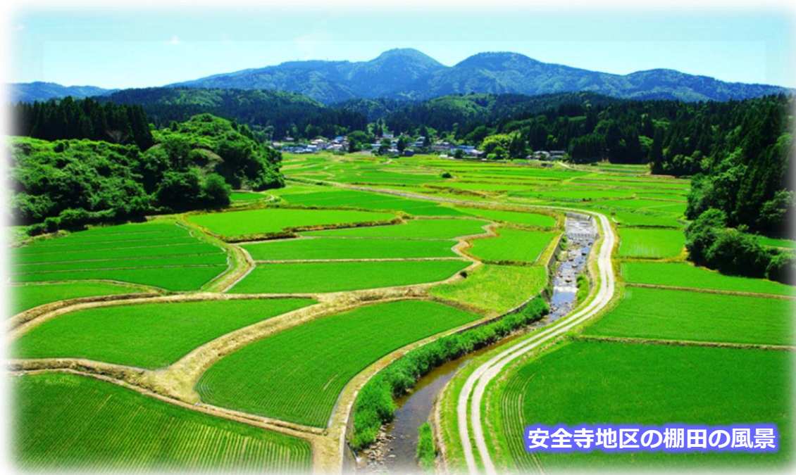
安全寺地区の棚田の風景