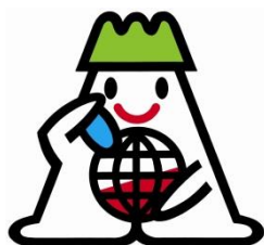
ストップ・ザ・温暖化あきたマスコットキャラクター 「あすぴー」