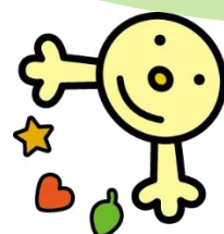
秋田県環境美化マスコット 「クリンちゃん」