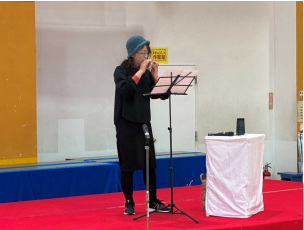
初出場! 「オカリナ さとちゃん」