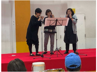
オカリナグループ 「レガート」