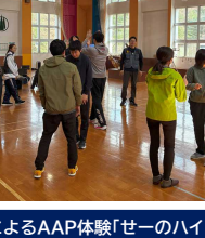
参加者によるAAP体験「せーのハイ!」

「令和8年度 利用説明会I」を4月16日(木)に行いました。6月21日まで来所予定の全12団体合計15名の皆様をお迎えして行いました。説明会の中では、実施プログラムの一部としてAAP(あきたアドベンチャープログラム)を実際に参加者で体験したり、炊事場で火の付け方のコツを事前学習したりしました。 自然の家の職員による食堂の使い方や宿泊施設の利用の仕方について説明を受けると、参加者は積極的に質問をしながら疑問点を解決したり、実際に予定しているプログラム内容の確認をしたりしていました。 今年度も、子どもたちが笑顔で生き生きと活動する姿が見られることを、今から楽しみにしています。