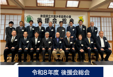
令和8年度 後援会総会

4月18日(土)に今年度の後援会総会が行われ、令和7年度の事業報告及び会計決算、令和8年度の事業計画及び会計予算が承認されました。後援会の皆様の寄付金によりリニューアルした大ちゃんも昨年度で大活躍。子どもたちは勿論各種イベントのキヤラクターからも一緒に写真撮影を依頼されるなど大人気でした。そして、所員による「ザ・ネイチャーバンド」のオカリナ演奏でも大いに盛り上げていただき、誠にありがとうございました。