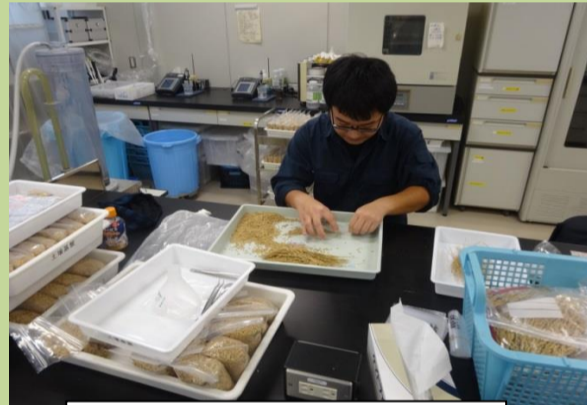
個体別の品質調査用調整