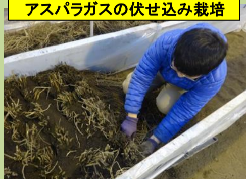
掘り上げた株を並べて、土を詰め、灌水