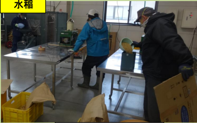
系統別の脱穀、脱芒