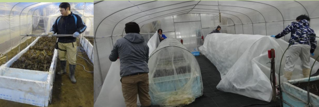
温室内にミニハウスを作り、その中でトンネル栽培