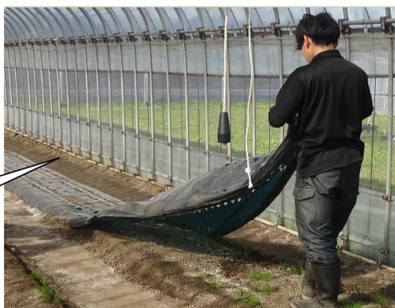
ハウス内の片付け