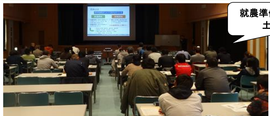
就農準備基礎講座 土づくり