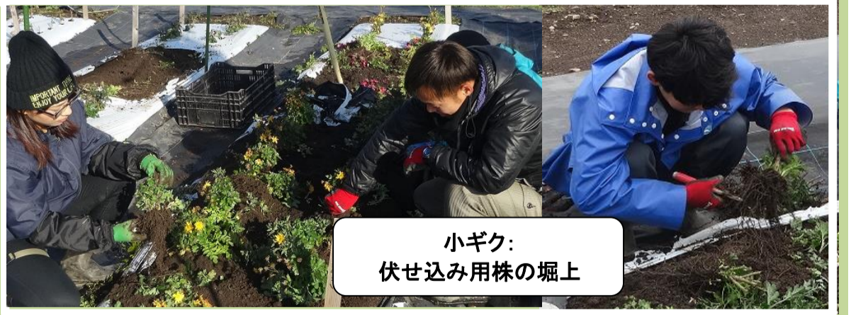
小ギク： 伏せ込み用株の堀上