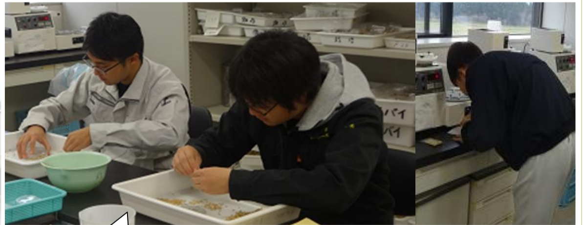
実験室内での調査