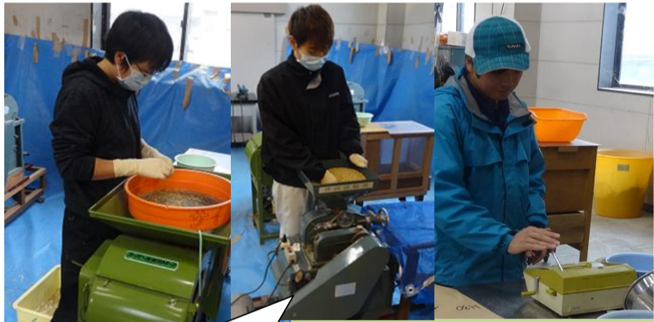
作業舎内での収穫調整・調査