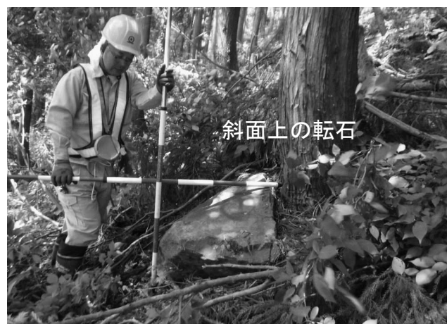
稲庭高松線 岩城（湯沢市）