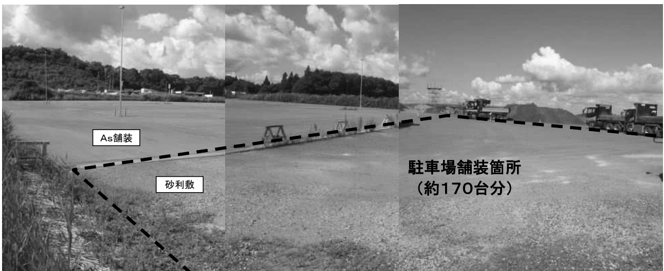
臨時駐車場現況写真