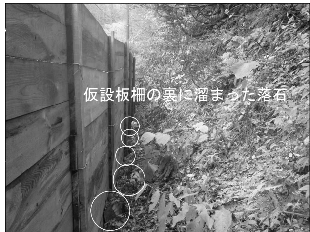
国道282号 古遠部沢国有林（小坂町）