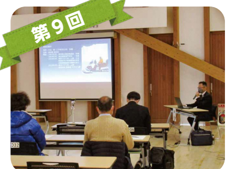
第9回 秋田に適した省エネ住宅について学びました。