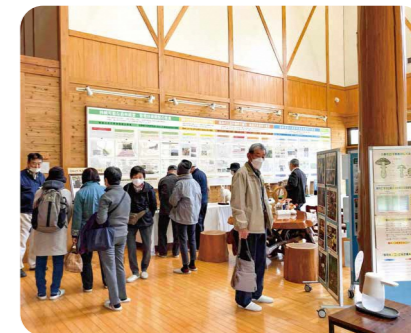
森林学習 (林業大学校)