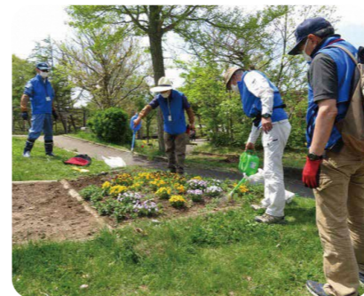
ガーデナー活動 (大森山動物園)

あきたエコマイスターの皆さんは積極的に行事やイベント等に参加し、自分にできる範囲で地球温暖化防止活動や環境啓発に取り組んでいます。