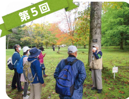
第5回 秋田市植物園で自然や生態系の大切さを学びました。