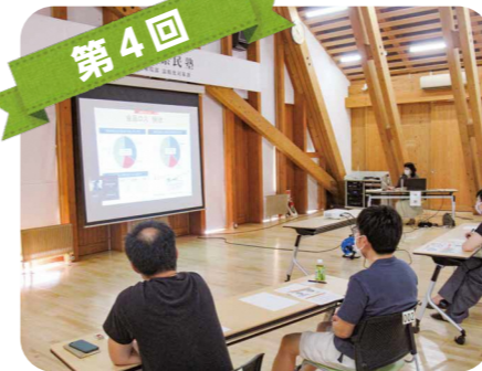
第4回 食品ロスの現状と削減のための取組を学びました。