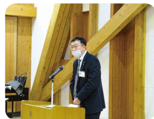
(秋田市 環境総務課長)