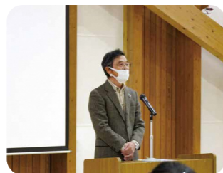
(エコマイ県央協議会 会長)