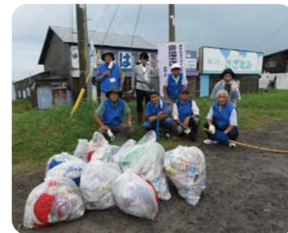
クリーンアップ活動 (出戸浜)