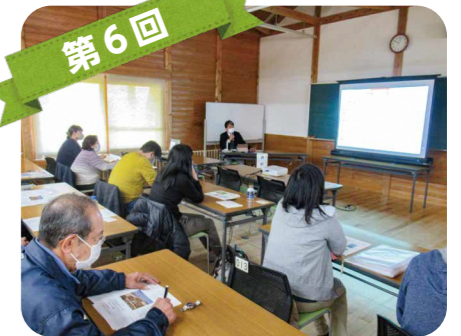
第6回 マイクロプラスチックの影響と各主体の取組を学びました。