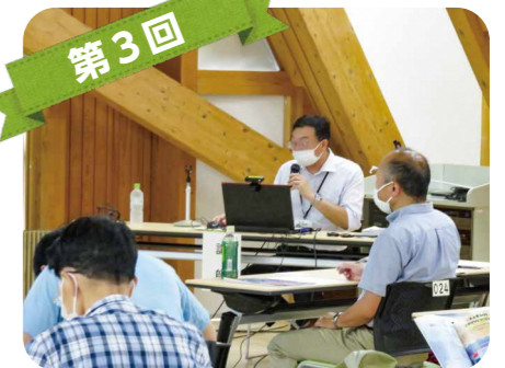
第3回 秋田市の課題と取組について学びました。