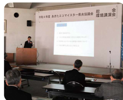
環境講演会 (小水力発電)