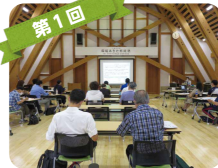
第1回 環境問題とSDGsとの関わりや秋田の環境について学びました。