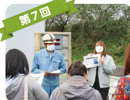
第7回 風力発電所を見学し、秋田の再生可能エネルギーを学びました。