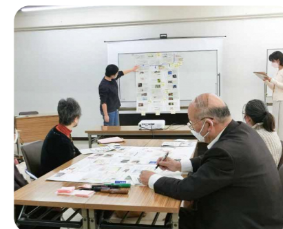
気候変動適応WSへの参加