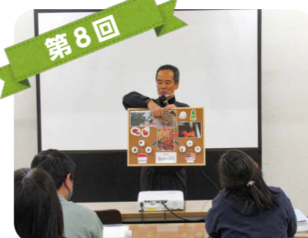
第8回 バイオマス発電から循環型社会について学びました。