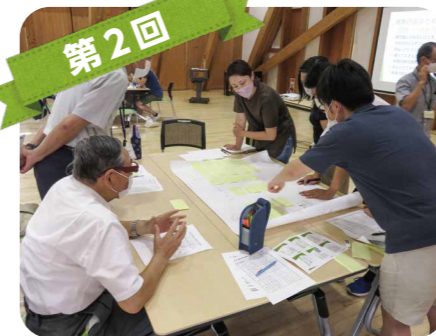
第2回 先輩エコマイスターを通じて課題解決の方法を考えました。