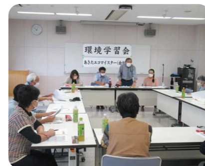
環境学習会 (食品ロス)