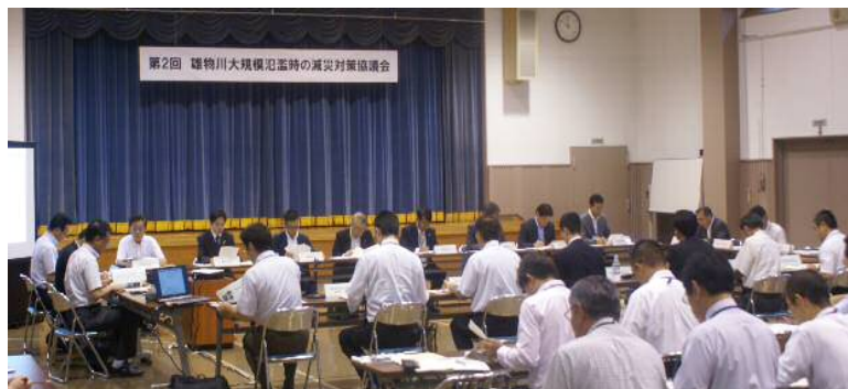
雄物川協議会の開催状況（平成28年8月9日）