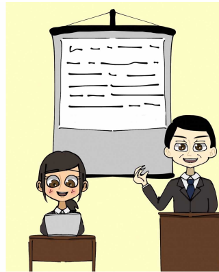
ようやくひっき 要約筆記

みみ き きこえない、きこえづらい方が、 じぶん いし たにん つた 自分の意思を他人に伝えるため、 て からだ うご かお ひょうじょう 手、体の動きや顔の表情によって ひょうげん め み げんご 表現する目で見える言語のこと。