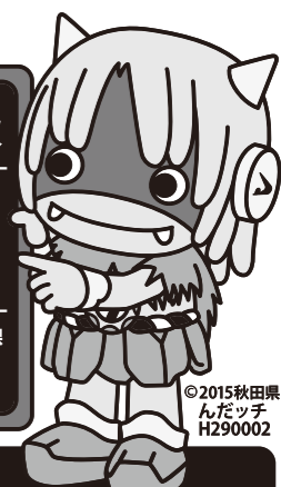
©2015秋田県 んだっ子 H290002