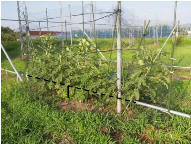
図1 一文字樹形(バナーネ)

「バナーネ」、「柘井ドーフィン」は2011年に、「ヌアールド・カロン」は2012年に、1年生苗を定植した（植栽距離：樹間6m×列間4m、植栽本数：10aあたり42本）。なお、2014年は凍害及び野鼠による被害が激しく、木の養成のため果実調査は行っていない。