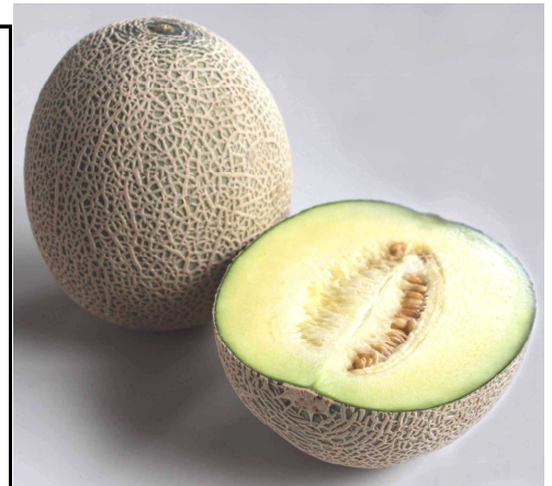
図1 「秋田あんめグリーン」の育成経過